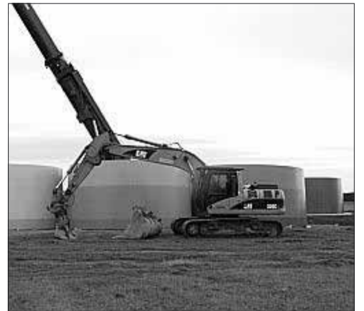
Zweieinhalb Kilometer hinter Herzberg werden zurzeit zwei Riesen- windräder aufgebaut.

Die Bürgerinitiative hat am Donnerstagabend getagt und beschlossen, am Montag der Einladung nach Herzberg zu folgen.