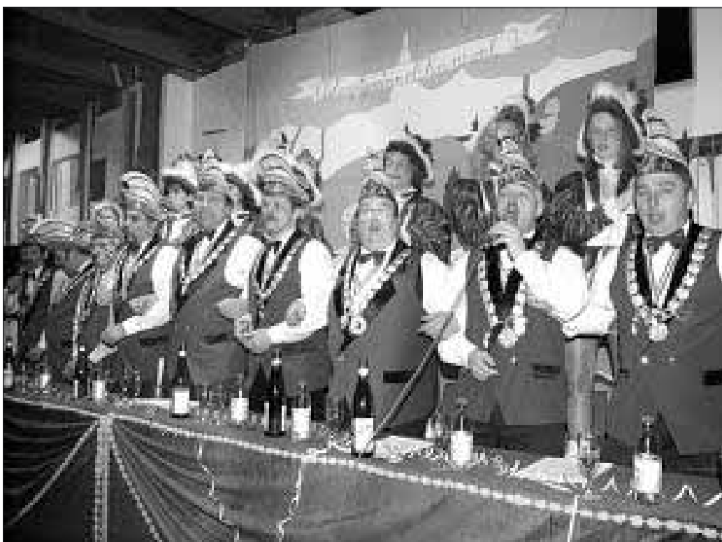
In ihrer 33. Saison treten die Lindower Jecken nur an einem langen Wochenende in Lindow auf. Zu se- hen sind sie aber auch in Herzberg, Klosterheide und Dabergotz.

Zurzeit hat der Freiwillige Karneval Klub Lindow (ge- gründet 1974) 35 Mitglieder. Ein paar mehr dürften es schon werden: Der Verein habe Nachwuchsprobleme, bedauert die 64 Jahre alte Vor- sitzende. Zwar konnten die Lindower ein paar neue Mäd- chen für ihre Funkengarde ge- winnen, doch der viele Stress so kurz nach Weihnachten ist nicht jedermanns Sache: bis zu dreimal pro Woche üben, dazu jeden Sonnabend Auf- tritt statt in die Disco – da muss man sich für den Karne- val schon richtig begeistern.